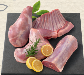
Frische ganze oder halbe Zicklein ohne Innereien