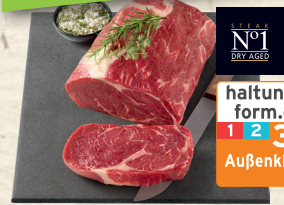
Das Original aus unserer Schatzkammer, Steak No. 1

nach einer fast vergessenen alten Lagermethode „Dry aged“ gereiftes Rindfleisch. Allerbestes Fleisch, das höchsten Qualitätsansprüchen entspricht