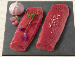
Frisch aus Neuseeland: Lammlachse ohne Knochen

ob gebraten, gegrillt, geschmort oder gekocht, mit feinen Kräutern zart gewürzt, in Rotweinbeize mariniert oder mit einer kräftigen Gabe Knoblauch – immer ein Hochgenuss!