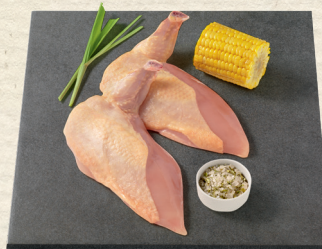
Maishähnchen supreme der leckerste Teil vom Hähnchen: Hähnchenbrust ohne Knochen, mit Haut und Flügel