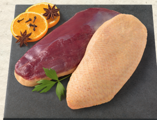
Frische französische Flugentenbrustfilets SB-verpackt