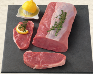
Zarte Kalbsrückensteaks vollfleischig