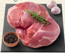
Frisch aus Neuseeland: Lammkeule ohne Knochen

ob gebraten, gegrillt, geschmort oder gekocht, mit feinen Kräutern zart gewürzt, in Rotweinbeize mariniert oder mit einer kräftigen Gabe Knoblauch – immer ein Hochgenuss!