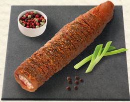
Schweinefilet gefüllt und würzig mariniert zum Garen