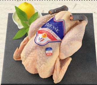
Bressehuhn das Hühnchen aus der Bresse, einer ehemaligen Provinz in Ostfrankreich. Die Hühner werden auf der Weide gehalten und erhalten zusätzlich neben Getreide auch entrahmte Milch als Futter