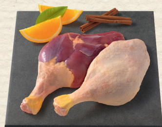
Frische französische Flugentenkeule SB-verpackt