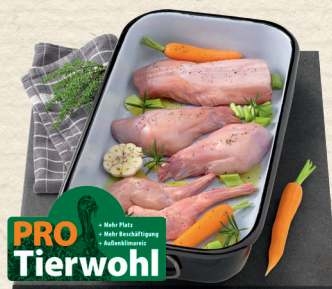
Frisches Kaninchen ganz aus kontrollierter Haltung, SB-verpackt