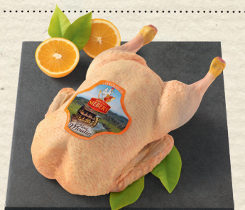
Frische französische Flugente