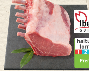
Iberico-Schweinefleisch eine Kreuzung aus weiblichen Iberico-Schweinen und männlichen Duroc-Schweinen. Karree mit Knochen, am Stück oder in Scheiben