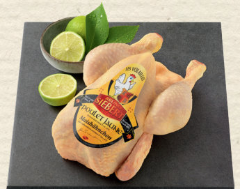
Frische französische Maishähnchen