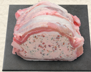
Kalbsbrust bratfertig gefüllt