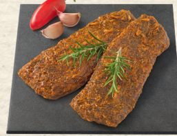
Lammlachse aus Neuseeland würzig mariniert